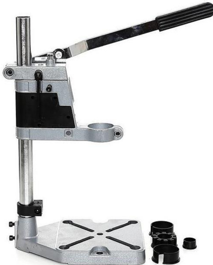
Rysunek 1. Statyw wiertarski – widok ogólny

Wykonaj naprawę i montaż statywu wiertarskiego (rysunek 1) oraz regulację i konserwację. Zamontuj za pomocą wkrętów stopki do płyty drewnianej zgodnie z rysunkiem 2. Podstawę statywu wiertarskiego zamontuj za pomocą śrub na środku płyty drewnianej zgodnie rysunkiem 3. W otworze do mocowania statywu zamontuj wiertarkę z wiertłem o średnicy 5 mm. Naprawę i montaż statywu wiertarskiego wykonaj z zachowaniem zasad bezpieczeństwa i higieny pracy związanych z użytkowaniem narzędzi skrawających i monterskich. Uporządkuj stanowisko pracy. Zakończenie montażu statywu wiertarskiego zgłoś przewodniczącemu ZN.